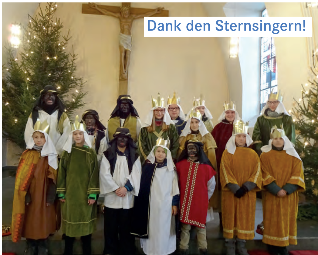
Dank den Sternsängern!

Auch in diesem Jahr haben sich unsere Sternsinger wieder auf den Weg gemacht, um Spenden für das Kindermissionswerk zu sammeln. Insgesamt 16 Sternsinger haben zunächst am Samstag, 6. Januar, die Vorabendmesse mitgestaltet und sich am darauffolgenden Sonntag unter dem Motto „Segen bringen – Segen sein – Gemeinsam gegen Kinderarbeit in Indien und weltweit“ auf den Weg durchs Dorf gemacht, um insgesamt 1402,13 Euro für notleidende Kinder zu sammeln. Allen Spendern ein „Herzliches Vergelt's Gott!“ und allen Sternsängern herzlichen Dank für euren Einsatz!